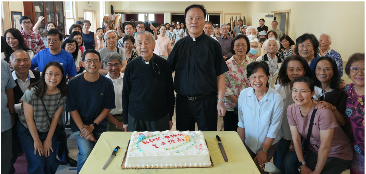
教友可到 https://aicc-cantonese.org/joomla5/index.php 瀏覽或於 8/31 前到 https://drive.google.com/drive/folders/IP69b5b-WRBYZ-7vIqo7nDN6tNt5kZ 下載更多相片。