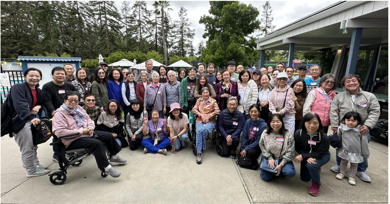
4/25/2026 SJCCM 粵語組同樂日花絮 (瀏覽及下載相片)